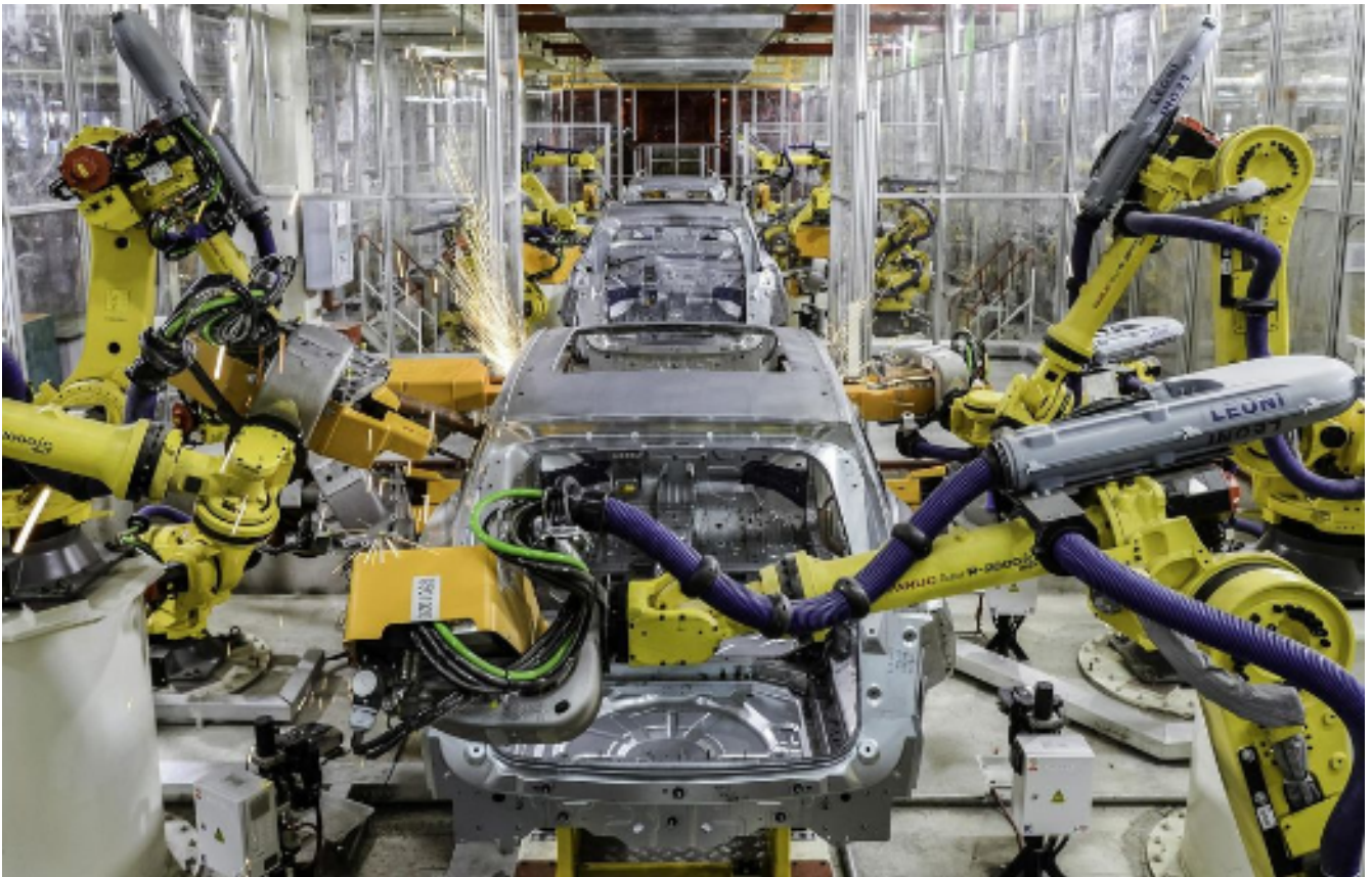
Une usine automobile chinoise à Chengdu (2016) – Les robots industriels dans le Monde : en 2019, la Chine a monopolisé 36,9 % du marché mondial des nouvelles capacités installées, contre 8,7 % pour les USA, soit moins du quart de la Chine...

avec la Chine, rien que sur le vent d'optimisme qui traverse l'esprit des gens de Pékin, malgré la misère et la condition horrible des travailleurs migrants de la ville... cela comparé aux travailleurs parisiens. Mais, grâce au grand travail d'abrutissement de la population française, une grande partie des travailleurs acceptent au final avec résignation, parfois même avec joie, la soumission et ne cherchent pas à en savoir plus. La médiocrité intellectuelle est très présente à Paris comme ailleurs ».